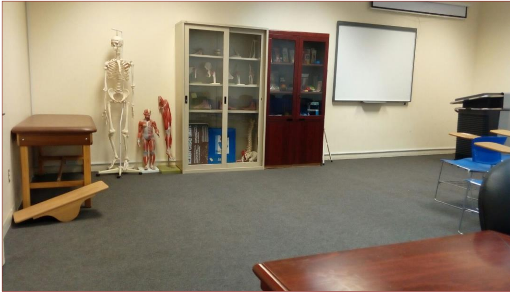
معمل الإصابات الرياضية والتأهيل