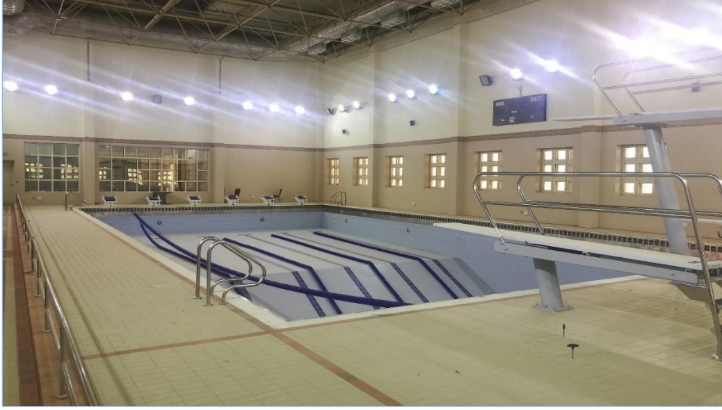
المسبح الرياضي بالصالة الرياضية