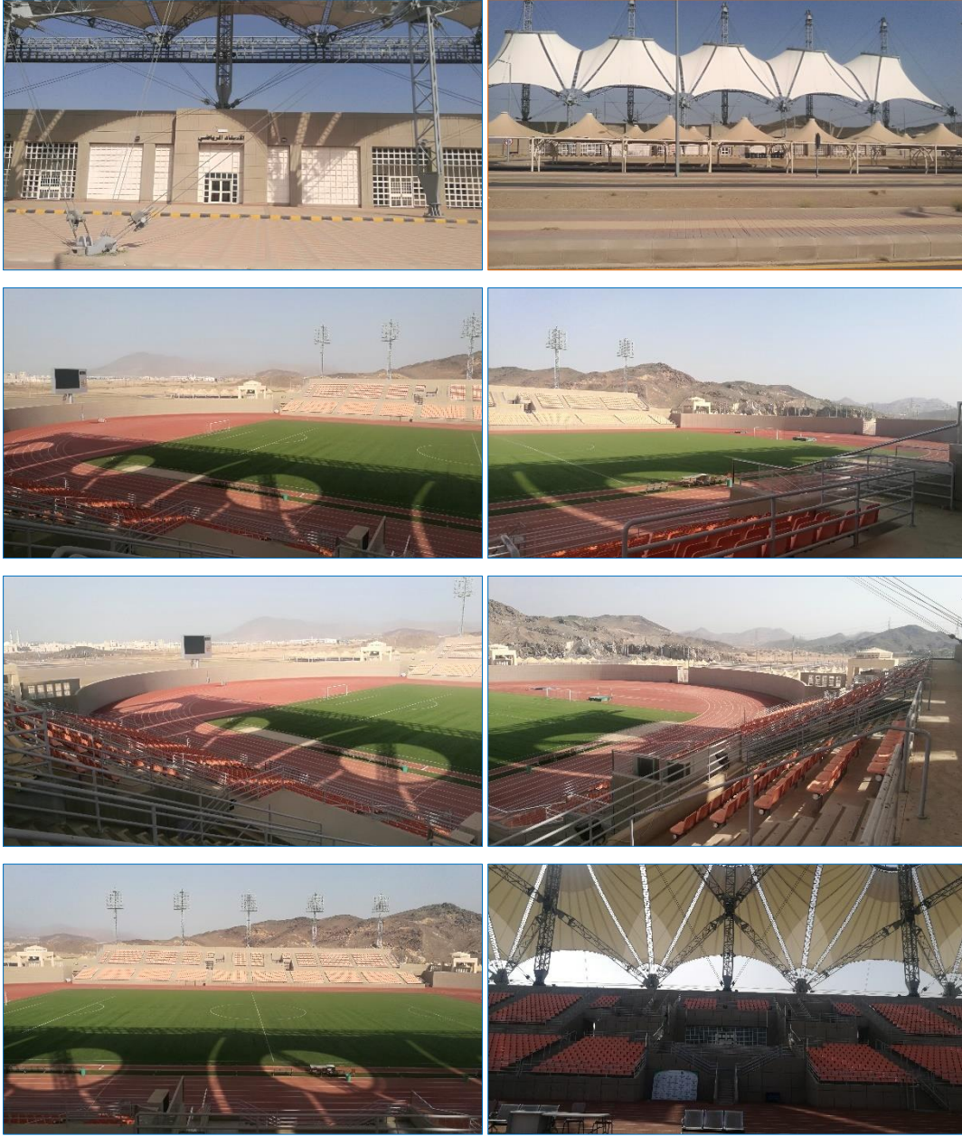
الاستاد الرياضي بجامعة أم القرى

يمكن اقامة محاضرات تدريسية لمقررات (كرة القدم وسباقات المضمار والرمي لألعاب القوى) بسعة ١٠٠ طالب باليوم الواحد.