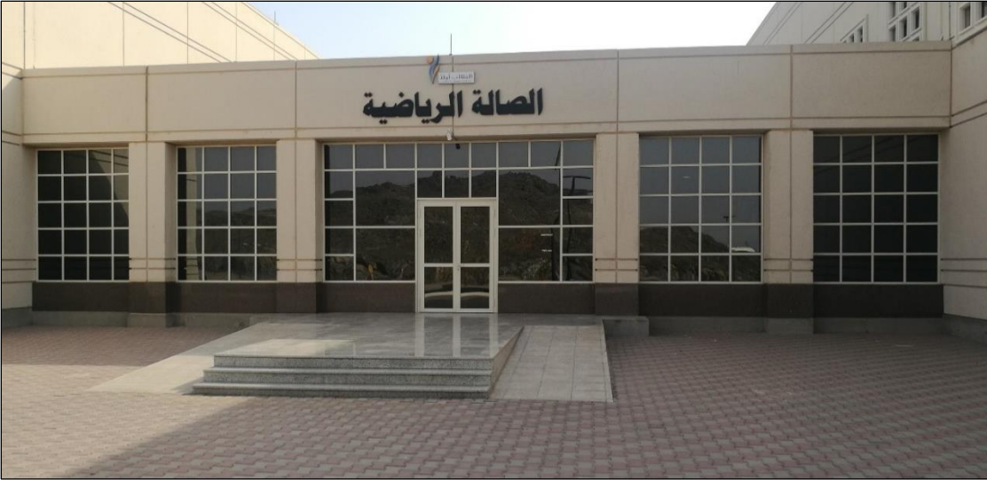
الصالة الرياضية بجامعة أم القرى